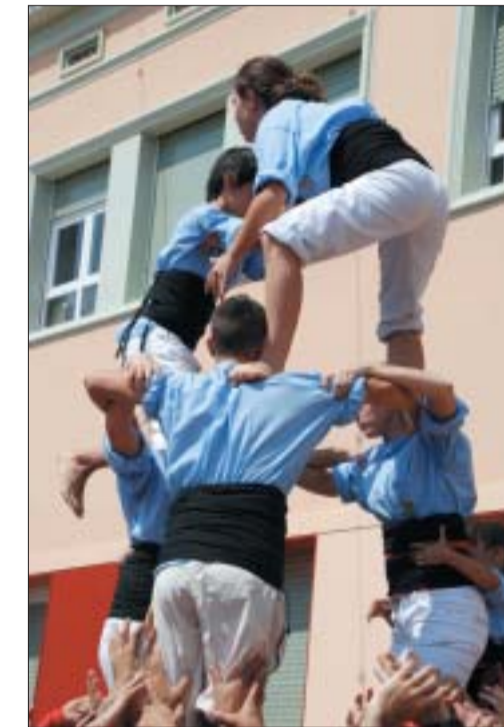
"Castells", "rom cremat" y ciclistas, tradiciones de la Festa Major colomense.

Casi todo, como siempre. El teatro, pagando, en un polideportivo. El deporte de élite marginado, pese a que el pregonero hizo el saque de honor en la Gramenet. La recepción a las entidades más pobre y con los invitados tratando de conseguir algún bocado del parco servicio. El recorte de presupuesto también llegó a las viandas.